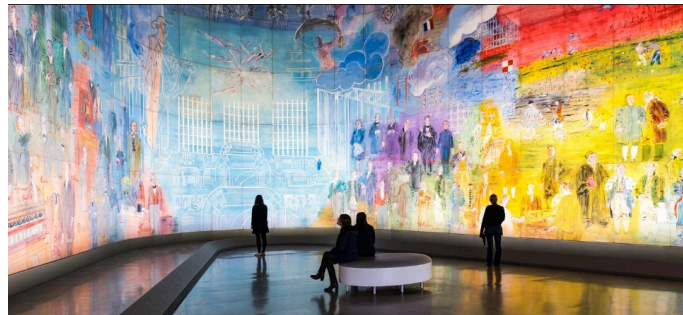
« La fée électricité » Raoul Dufy 1937