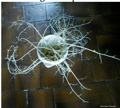
Pommes de terre germées