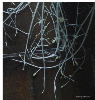
« Graphisme » de pomme de terre