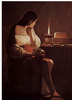
« Madeleine à la veilleuse » Georges de la Tour 1642/1644