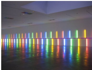
« Site-specific » installation Dan Flavin 1996

Pour travailler le graphisme en noir et blanc, on peut également s'inspirer de l'album